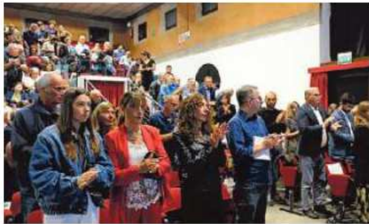
Il teatro Belvedere esaurito ieri sera